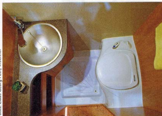
Ausgeklügelt: Unter dem zweigeteilten Tisch steht der Kleiderschrank. Das nach hinten verlängerte Bad birgt sogar eine kleine Dusche.